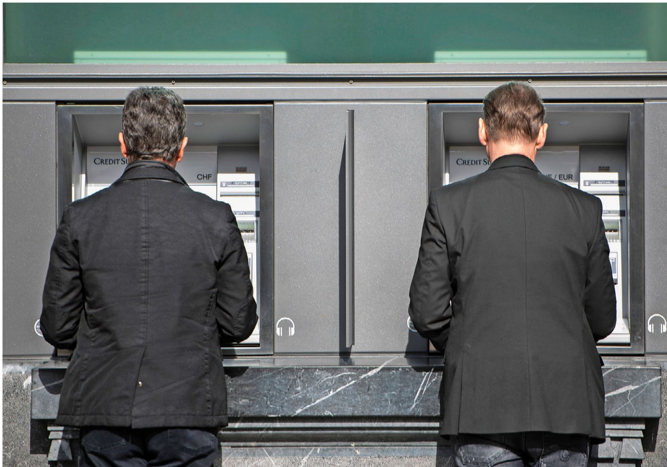
Banken könnte wegen ihrer hohen Gebühren beim Transfer von Wertschriften eine Klage drohen.